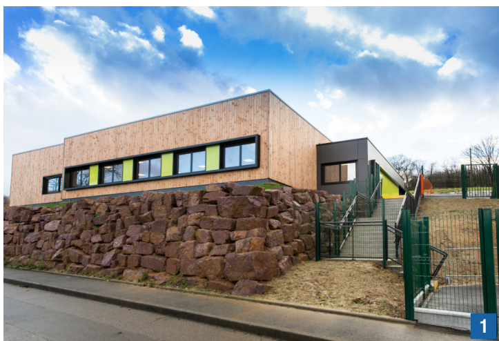
1 Vues extérieures des bâtiments